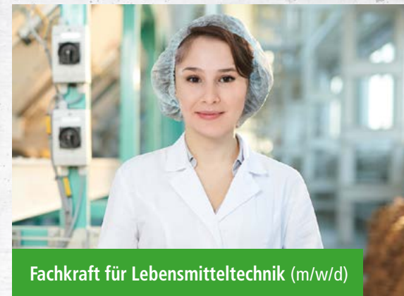
Fachkraft für Lebensmitteltechnik (m/w/d)

Wir bieten Dir zur Orientierung gern ein Praktikum an. Bei Interesse an Praktikum oder Ausbildung, sende uns gerne Deine vollständigen Bewerbungsunterlagen per Post oder als PDF per E-Mail an personal@sauerteig.de .