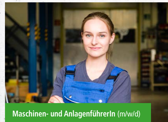
Maschinen- und AnlagenführerIn (m/w/d)