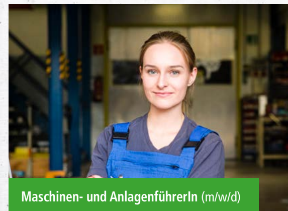
Maschinen- und AnlagenführerIn (m/w/d)